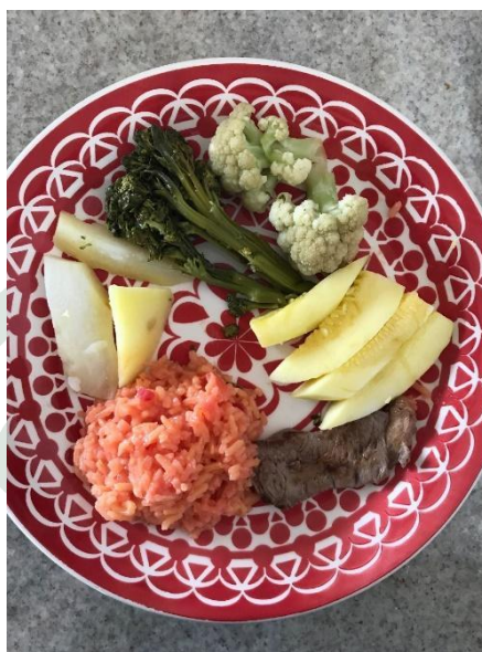
FIGURA 5 – Exemplo de alimentos ofertados quando o bebê está na fase transitória, alcançando a dieta dos pais.

Aqui acontecerá uma sessão com posterior envio de material, contendo as observações constatadas na visita e as possíveis orientações. Lembrando que o canal de comunicação ficará sempre aberto por meio das redes sociais (whatsapp).