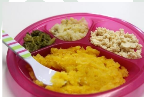
FIGURA 4 – Exemplo de preparo de alimentos em textura de papa sem que eles estejam misturados ou compondo uma receita, apenas amassados no garfo e oferecidos separadamente.

A fase 1 será dividida em 2 encontros, uma primeira visita com o papel de diagnóstico situacional, conversa, tira-dúvidas e percepção do ambiente. Seguida do envio de material desenvolvido unicamente e especialmente para aquela família em questão, no formato de PDF, em torno de 10 dias após a primeira visita. O segundo encontro acontecerá 15 dias após o primeiro e nele será vivenciado uma prática na cozinha de preparo de alimentos de acordo com a escolha do método eleita pela família/observação do bebê. Digo observação do bebê, pois, certa vez, atendendo a uma família que os pais se sentiam inseguros por iniciar a alimentação do seu bebê por meio de alimentos sólidos, orientei e enviei todo o material de apoio considerando a abordagem funcional e gentil de uma IA em que o alimento seria oferecido na