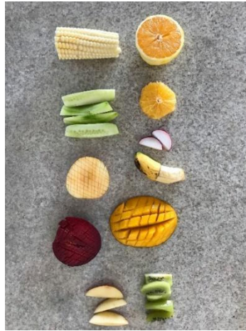
FIGURA 3 – Exemplo de cortes que facilitam a pega do bebê na primeira fase.

A reprodução desse artigo na íntegra está proibida. Para referenciar trechos / partes, utilize ALONSO, Agnes Scheilla Marinho. DESENVOLVIMENTO DE UM PROGRAMA DE INTRODUÇÃO ALIMENTAR (IA) PARA BEBÊS FUNDAMENTADO NA PSICOLOGIA CORPORAL PARA PREVENÇÃO DE TRAUMAS DA ORALIDADE. Susana Z.; ALMEIDA, Fabiana A.R.. Revista Online , Trabalhos em Psicologia Corporal Reichiana. Araraquara, 2019: Instituto Raiz, Clínica Escola de Psicologia Corporal. https://institutoraiz.com.br/ Acesso em: _/_/_